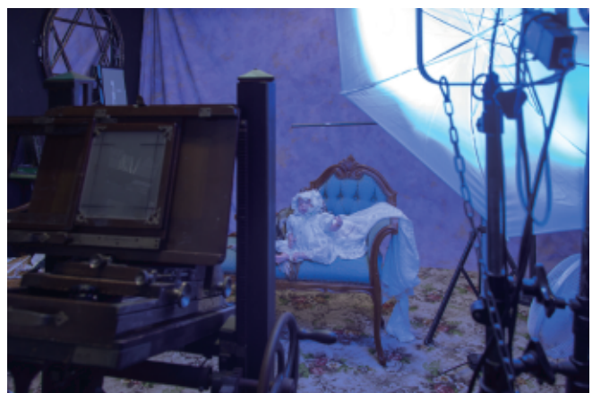
《Pre-alive Photography》制作風景 湿板写真撮影

日時：6月29日(土)午後2時開始 予約：要予約(受付は6月26日午後5時まで) 講師：和田高広(ライトアンドプレイス湿板写真館) 参加費：一人5000円 対象：小学生以上 人数：先着7組(1組あたり最大4人まで) 内容：《Pre-alive Photography》制作に使用した写真技法「湿板写真」でポートレートを撮影します。数秒間静止して撮影する体験をはじめとして、ガラスに溶剤を塗布する工程や現像で像が浮かび上がる過程をご覧いただけます。希望する方は実際にカメラを触って撮影することも可能です。撮影した一点ものの写真は後日お持ち帰りいただけます。