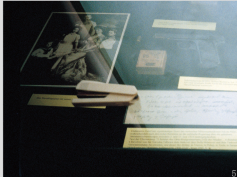
Cover. 「時間 家の中で 家の外で / Time Indoors Outdoors」2000 1. 「My Stapler On The World War」2017 2. 「爆弾か 黒雪ダルマ 雪ダルマ / Snowman, It's Like a Bomb.」2016 3. 「その時のしるし / There Once Was」2013 4. 「ナルシスの視点 / Narcissus—A New Translation」2005 5. 「My Stapler On The World War」1999

横湯久美は、死者の声は本当にもう聴けないのか、生き残った者は死者や過去とどのようにつき合うのかを写真とテキストで探ってきたアーティストです。