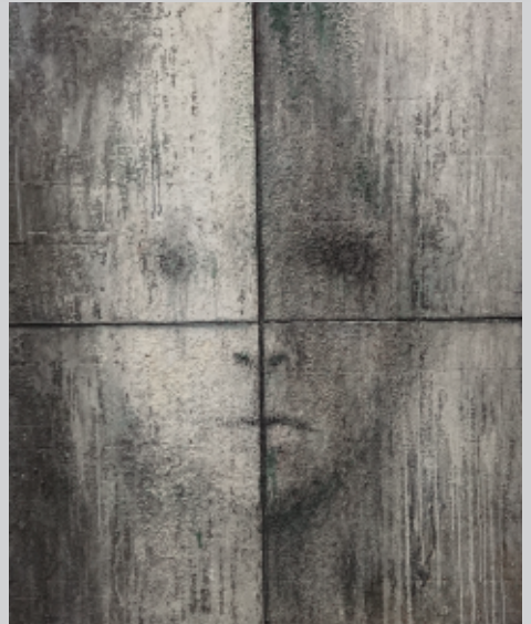
METAL RAIN 20-E 2020年