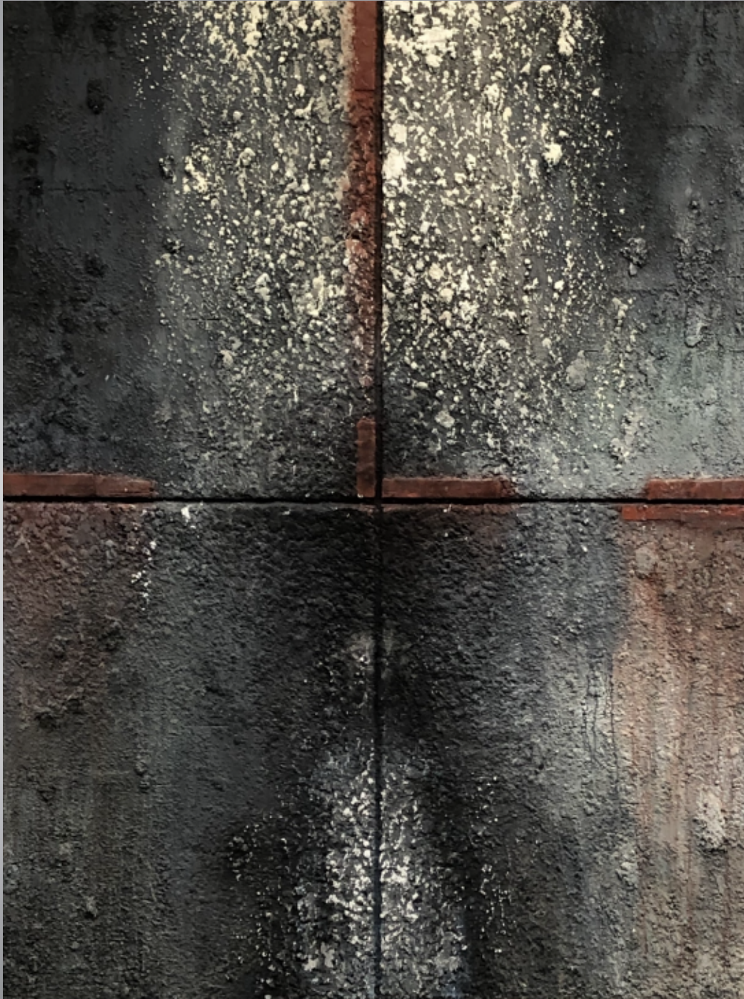
20-F METAL RAIN 壁・人 2020年