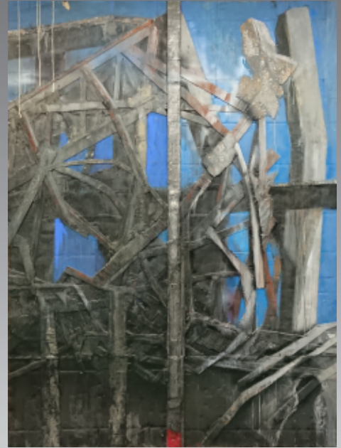
METAL RAIN 04-C 2004年