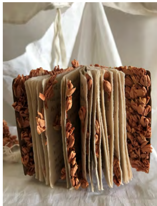
表面：屠畜場からの眺め 油彩、キャンバス 2024年 裏面左上：屠畜場からの眺め 2 油彩、キャンバス 2024年/ 右上：小さな人々、赤い アクリル、段ボール紙 2023年/右下： 旅のノート 古紙、花 2023年8月